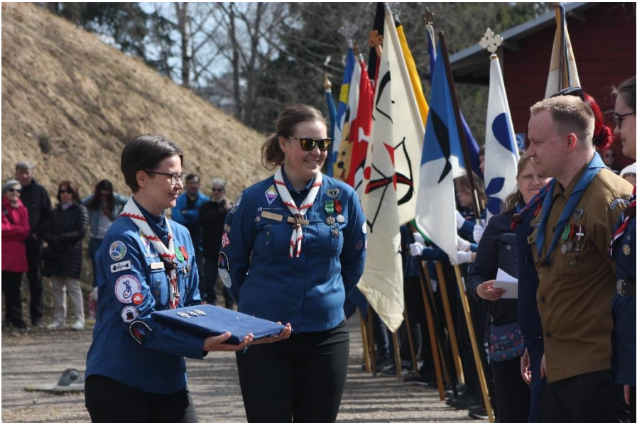
Kuva: Hanna Miikki

Tietoa ansiomerkeistä ja niiden ehdottamisesta tarjottiin lippukuntiin Ajankohtaista ansiomerkeistä -viesteillä. Samalla noilla viesteillä myös muistuteltiin ansiomerkkiehdotusten määräpäivien lähestymisestä. Yhteisten koulutusten lisäksi lippukuntia tuettiin ansiomerkkien ehdottamisessa mm. ohjeistamalla ja vastaamalla lippukunnilta tulleisiin kysymyksiin.